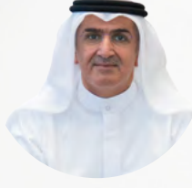
معالي السيد / باسل أحمد الهارون

محافظ بنك الكويت المركزي رئيس مجلس الإدارة