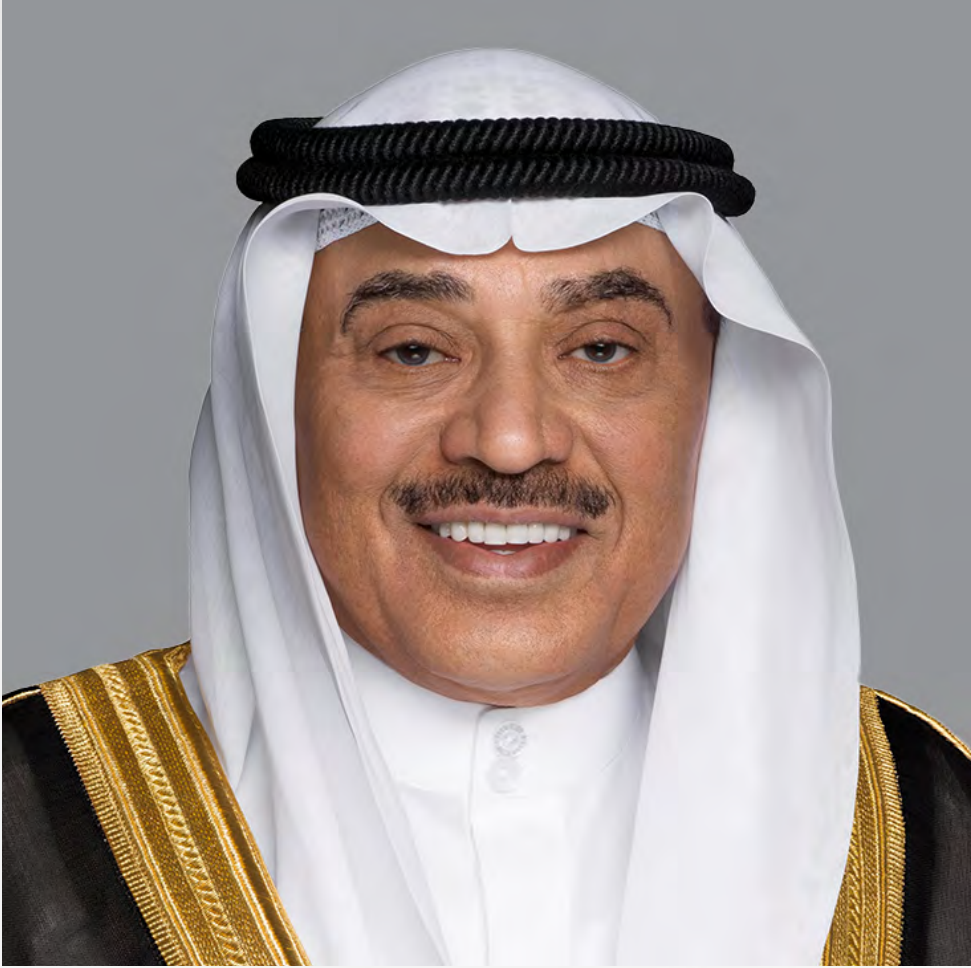
سمو ولي العهد الشيخ صباح خالد الحمد الصباح حفظه الله