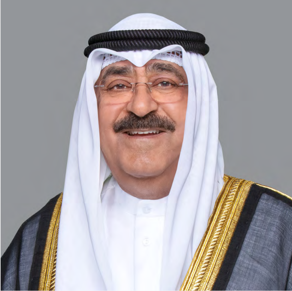
حضرة صاحب السمو أمير البلاد المفدى الشيخ مشعل الأحمد الجابر الصباح حفظه الله ورعاه